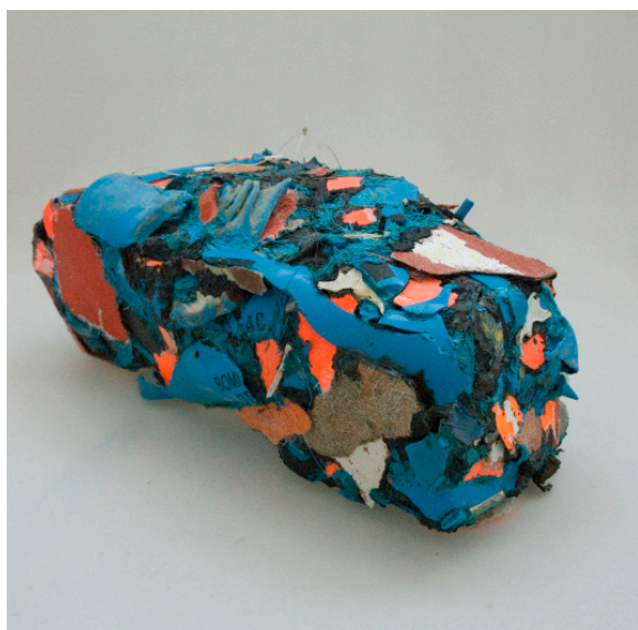
SAINTE-BARBE, CHAMP DE TIR DE L'AVIATION MILITAIRE 2011

LIEU D'EXPOSITION EN VOIE DE DÉPLACEMENT (LEVD)