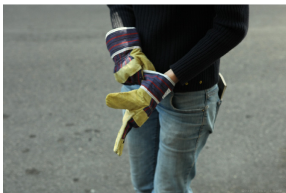
À DOS DE DIABLE [DÉPLACEMENT]

LIEU D'EXPOSITION EN VOIE DE DÉPLACEMENT (LEVD)