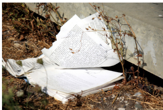
- ES IST ALLES IN ORDNUNG. - DEN KANN ICH GEHEN.

- TOUT EST EN ORDRE. - ALORS, JE PEUX PARTIR.