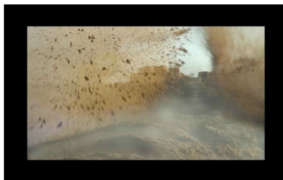
FLIPBOOK («CES OISEAUX DE MORT»)

Appareil photographique Os divers, fragments d'obus, fragments de cibles, diapositives 4x5 inch rétroéclairées 50 x 35 x 35 cm